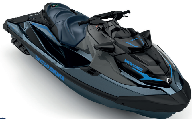
Blue Abyss / Gulfstream Blue